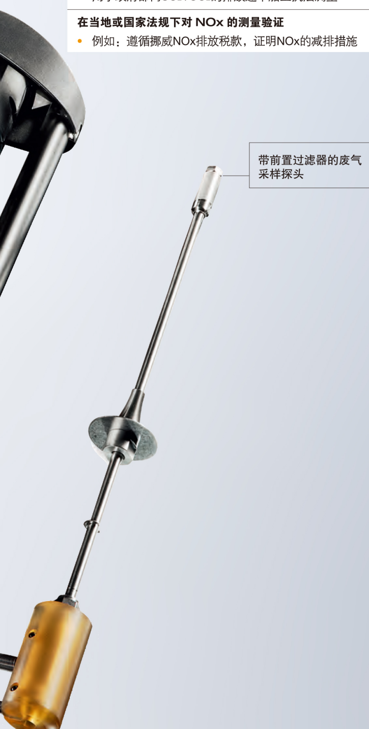
带前置过滤器的废气采样探头