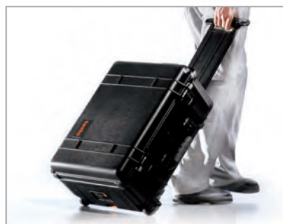
实用的运输保护箱