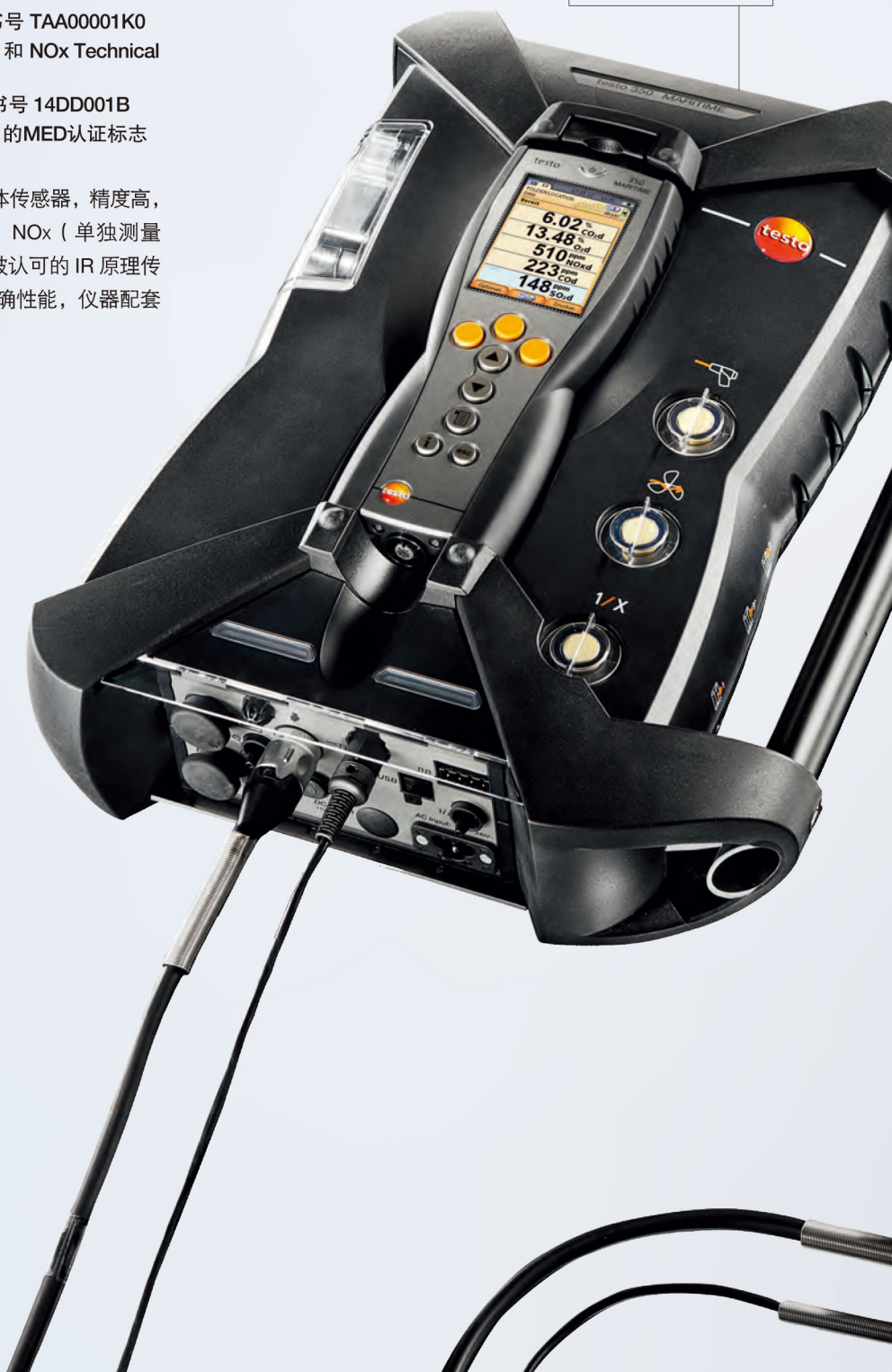
船用烟气分析仪 testo 350